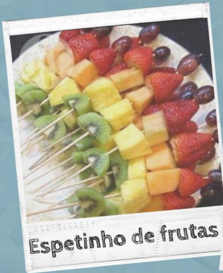
21108463544 Espetinho de frutas